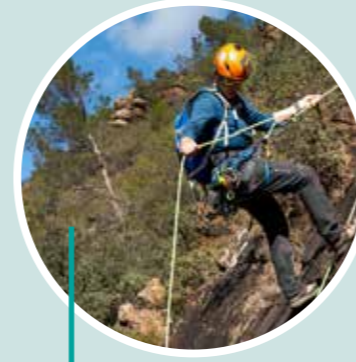
Aventura vertical Gorgo Aventuras y Casa Rural El Gorgo