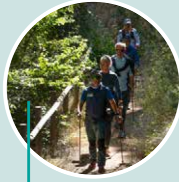
Experimenta la marcha nórdica Tierra de Sendas.