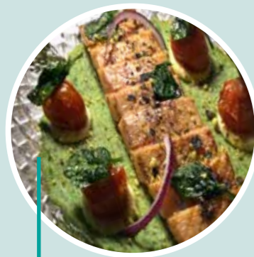
Cena de maridaje con menú degustación Restaurante La Vaca