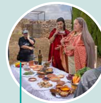
Descubre el Secreto Visigodo Yacimiento visigodo Pla de Nadal, Museo del Pla de Nadal - Arca Cultural