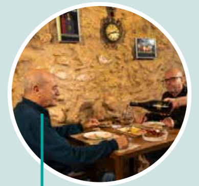
Descubriendo la gastronomía de la ruta de la seda Restaurante El Vermut