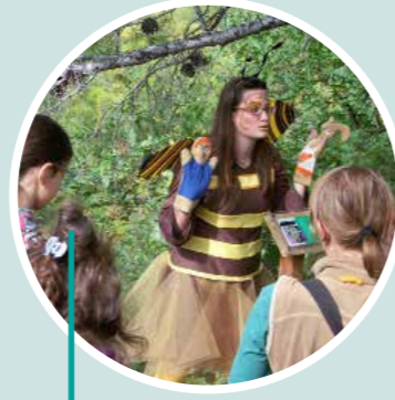
¿Sabes cómo hacer un aeropuerto para abejas? Calderona Viva