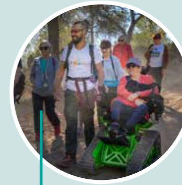
Baño de bosque accesible con viaje sonoro Turismo adaptado V3