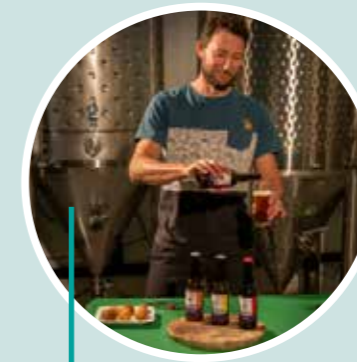
Cerveza y croquetas: una experiencia gastronómica en la Poble de Vallbona Cerveza la Terrissa ZOITAS O.E. (Groguetes)