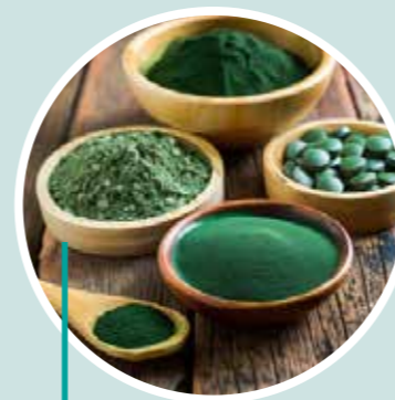
Conoce el cultivo de la espirulina Ecospirulina