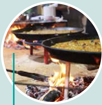
Masterclass de paella valenciana Restaurante Levante.