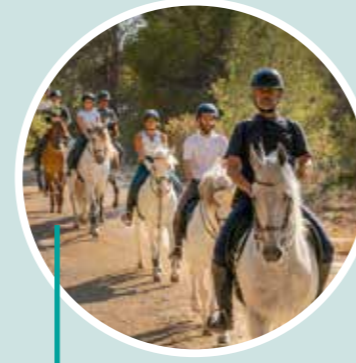
Aventura ecuestre con sabor Field & Horse Restaurante El Vermut