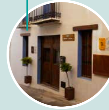
Escapada aventura rural Gorgo Aventuras y Casa Rural El Gorgo