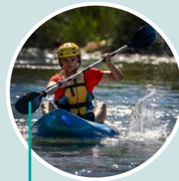
A través del Turia en kayak Valencia Adventure