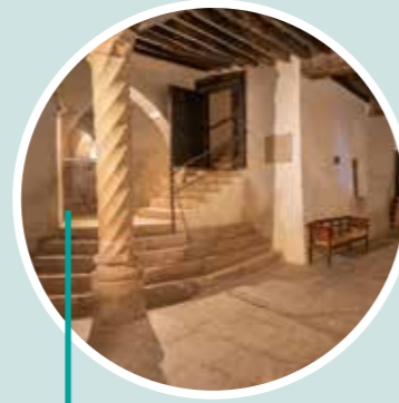
Cultura y gastronomía en Benissanó Restaurante Levante Castillo de Benissanó - Exdukere difusión cultural