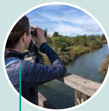
Birdwatching en Riba-roja de Túria Visit Natura