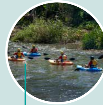
De perdidos al río Tierra de Sendas Valencia Adventure