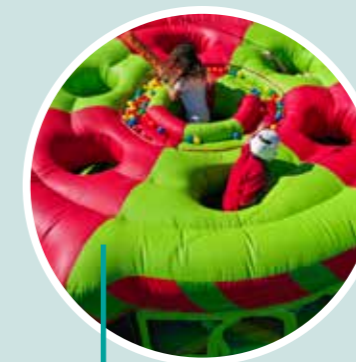
Diversión para los peques de la casa Urban Adventure