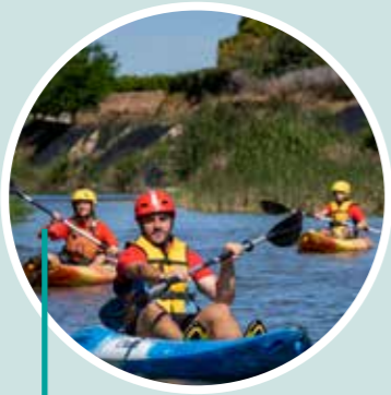
Descenso en rafting por el Turia. Valencia Adventure