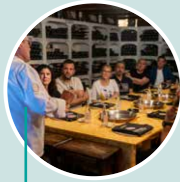
Una Masterclass con historia Restaurante Levante Castillo de Benissanó - Exdukere difusión cultural