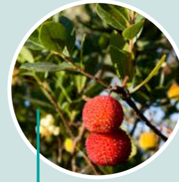
Conoce el poder de las plantas Ecospirulina Calderona Viva