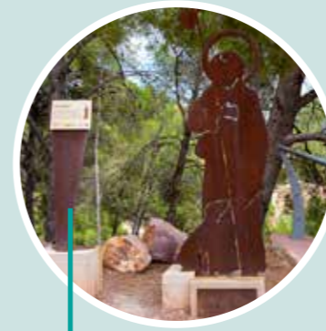
Historia, teatro y gastronomía en Serra Calderona Viva Bar Restaurant Descanso de Serra