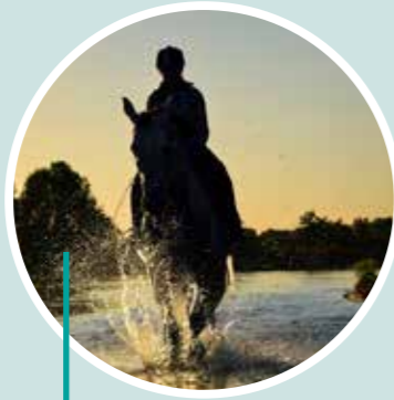
Paseo a caballo por el Parque Fluvial del Turia Field & Horse