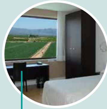
Fin de semana a caballo Field & Horse Restaurante El Vermut Hotel Puerta de la Serranía